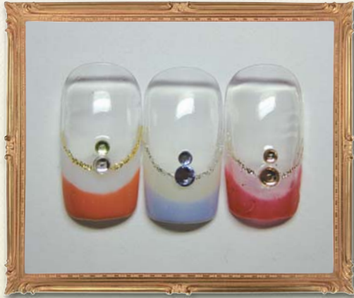
No.1 Wフレンチ (境目ラメライン付き) ¥15,120 ▶▶▶ ¥11,000

毎月恒例のネイルサロン シルシオンの新春キャンペーンは、CIRSIONの人気デザインBEST5をキャンペーンにしました。当店の人気デザインネイルをぜひお試しください。