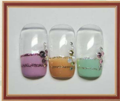
No.4 ポーダー風フレンチ (Wラメライン付き) ¥15,330 ▶▶▶ ¥11,000