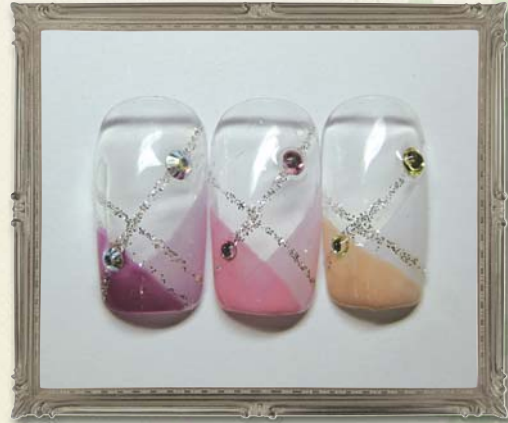
No.2 クロスフレンチ (Wラメライン付き) ¥15,330 ▶▶▶ ¥11,000