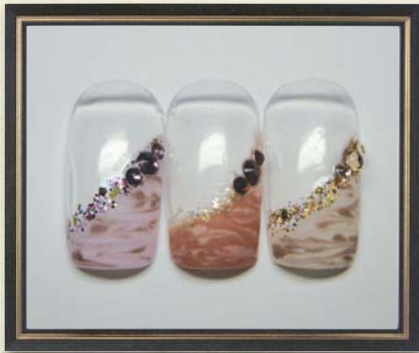
No.3 ななめマーブルフレンチ (境目ラメ付き) ¥15,330 ▶▶▶ ¥11,000