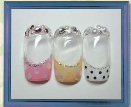
No.5 ドットフレンチ (境目ラメライン付き) ¥14,700 ▶▶▶ ¥11,000